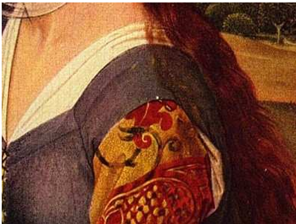
Ausschnitt Rogier van der Weyden um 1450 von Oli

Ergänzungen und Korrekturen werden bei neuen Erkenntnissen vorgenommen. Bildbelege (mit Quellennachweis!) sind willkommen.