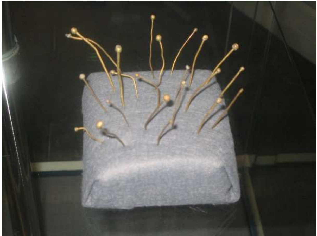
Gewandnadel Originalfunde Köln von Oli