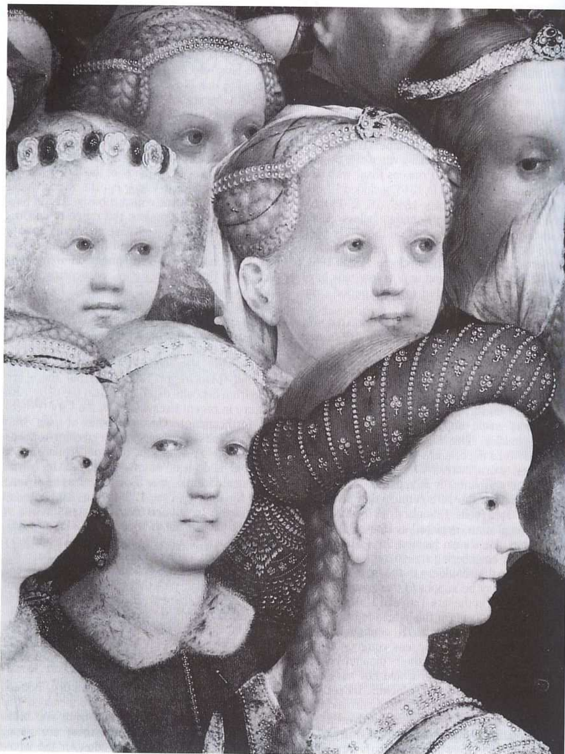
198 Stefan Lochner, triptych c. 1440, Cologne cathedral. Detail showing ladies wearing pins in their hair and dress